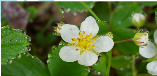
Fraisier des champs