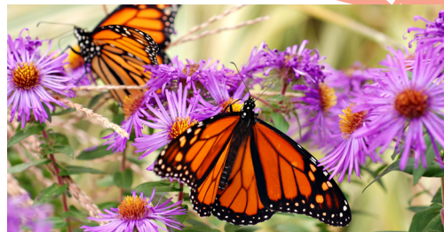
Aster de Nouvelle-Angleterre