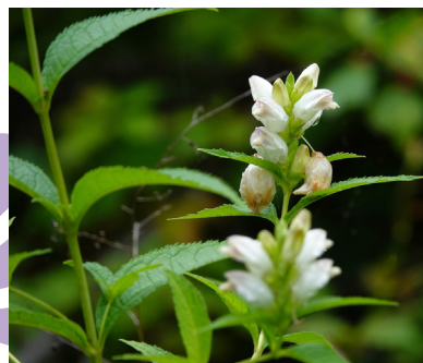
Galane glabre (Ian Whyte)